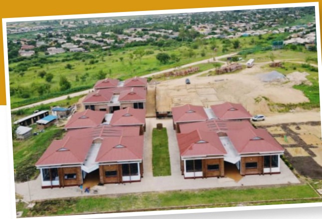
Titelfoto: Viele der Schulkinder stammen aus armen Familien (hier Sechstklässlerinnen). Foto links: Der gesamte Schulkomplex aus der Vogelperspektive betrachtet.

die digitalen Medien dann nicht nutzen, Lehrkräfte müssen zum Ausdrucken und Kopieren von Materialien in Internetcafés ausweichen.