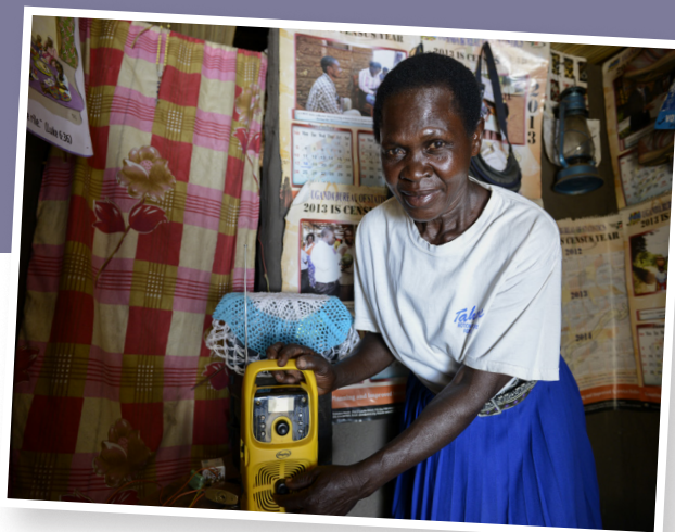
Durch die Sendung „Wir sind ein Volk“ wird auch bei den Einheimischen Verständnis für die Situation der Flüchtlinge geschaffen.

bestes Radio Afrikas ausgezeichnet. Die Programmangebote sind vielfältig: Pastorale Programme geben dem Hörer spirituelle Impulse, Informations- und Diskussionsprogramme klären die Bevölkerung auf und verleihen ihr eine Stimme. „Community voices“, also „Stimmen der Gemeinschaft“ , heißt das Programm, mit dem Radio Pacis in die Dörfer geht. Das Reporterteam spricht Themen an, die die Leute beschäftigen. Auch heikle Themen wie die Alkoholsucht in vielen Dorfgemeinschaften werden aufgegriffen. Aber auch in den Flüchtlings-siedlungen geht Radio Pacis auf Sendung. Inhalte sind der Zugang zu Wasser, Gesundheitsvorsorge und auch Konflikte mit der einheimischen Bevölkerung werden thematisiert. „Wir sind ein Volk“ heißt eine der Sendungen, die mit und für Flüchtlinge produziert wird. Etwa 100 Menschen finden bei Radio Pacis Arbeit - als Journalisten, Tontechniker und in der